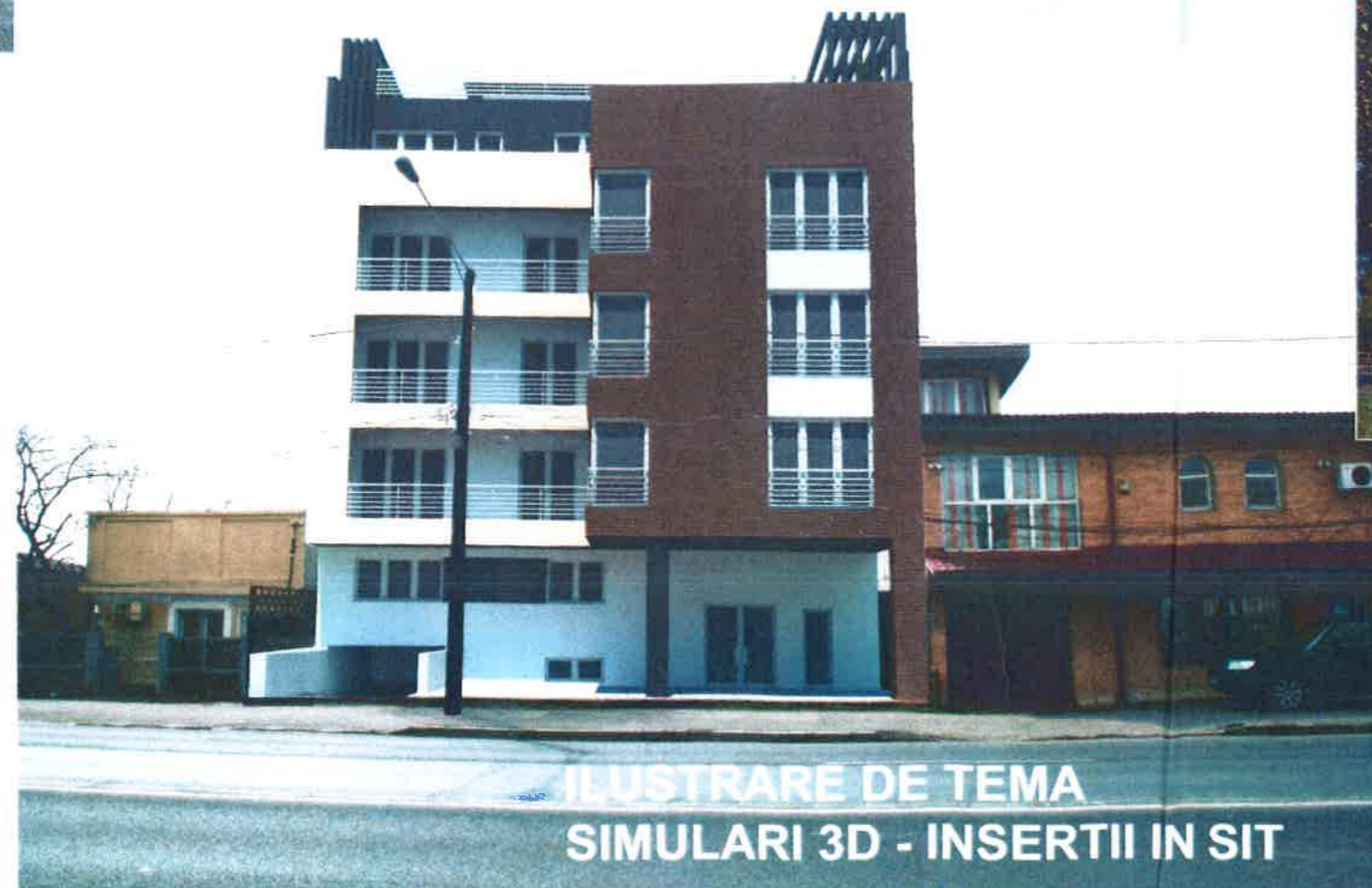
ILUSTRARE DE TEMA SIMULARI 3D - INSERTII IN SIT

AUTORUL PREZENTEI DOCUMENTATII ESTE S.C. BIROU-ARHITECTURA HOBBY CONSTRUCT S.R.L. SI DETINE DREPTURILE EXCLUSIVE DE COPYRIGHT