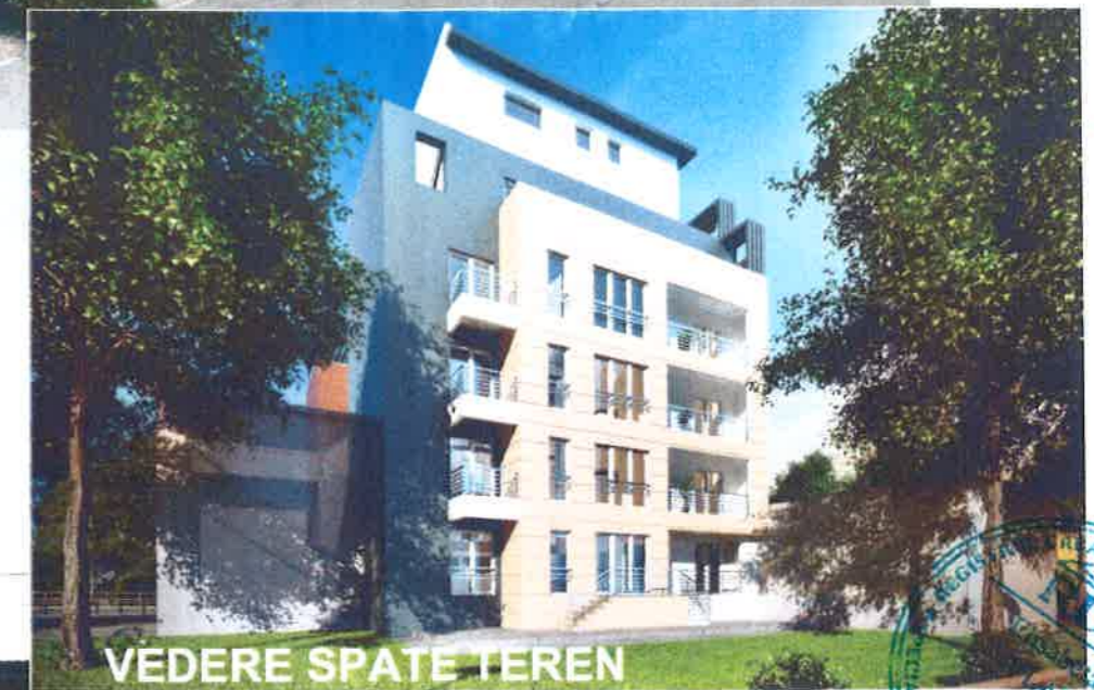
VEDERE SPATE TEREN