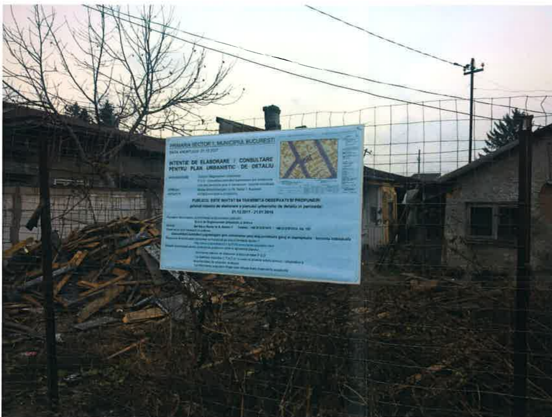
FOTOGRAFII CU PANOU EXPUS LA TEREN DIN DATA DE 20.12.2017