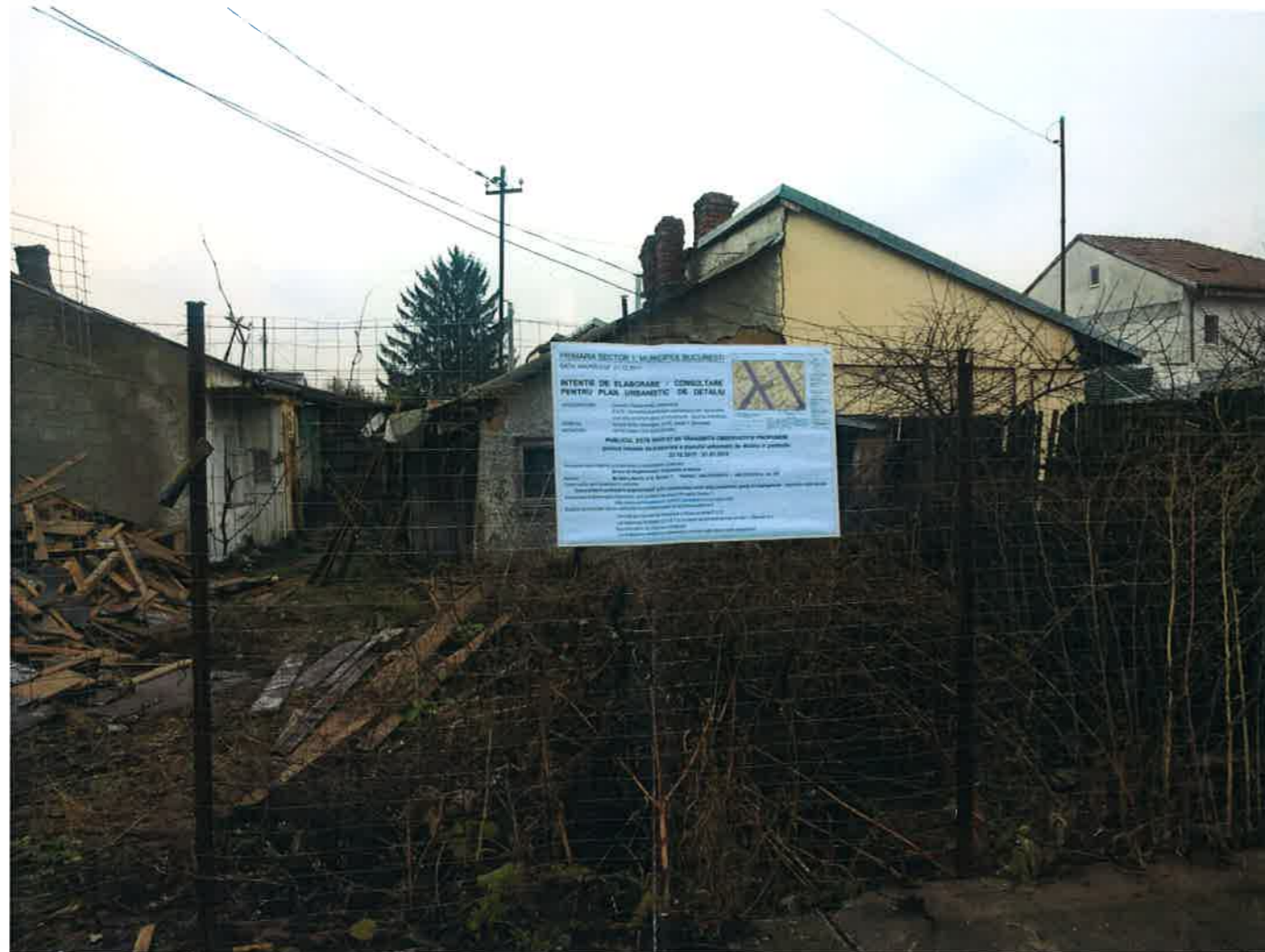
FOTOGRAFII CU PANOU EXPUS LA TEREN DIN DATA DE 20.12.2017