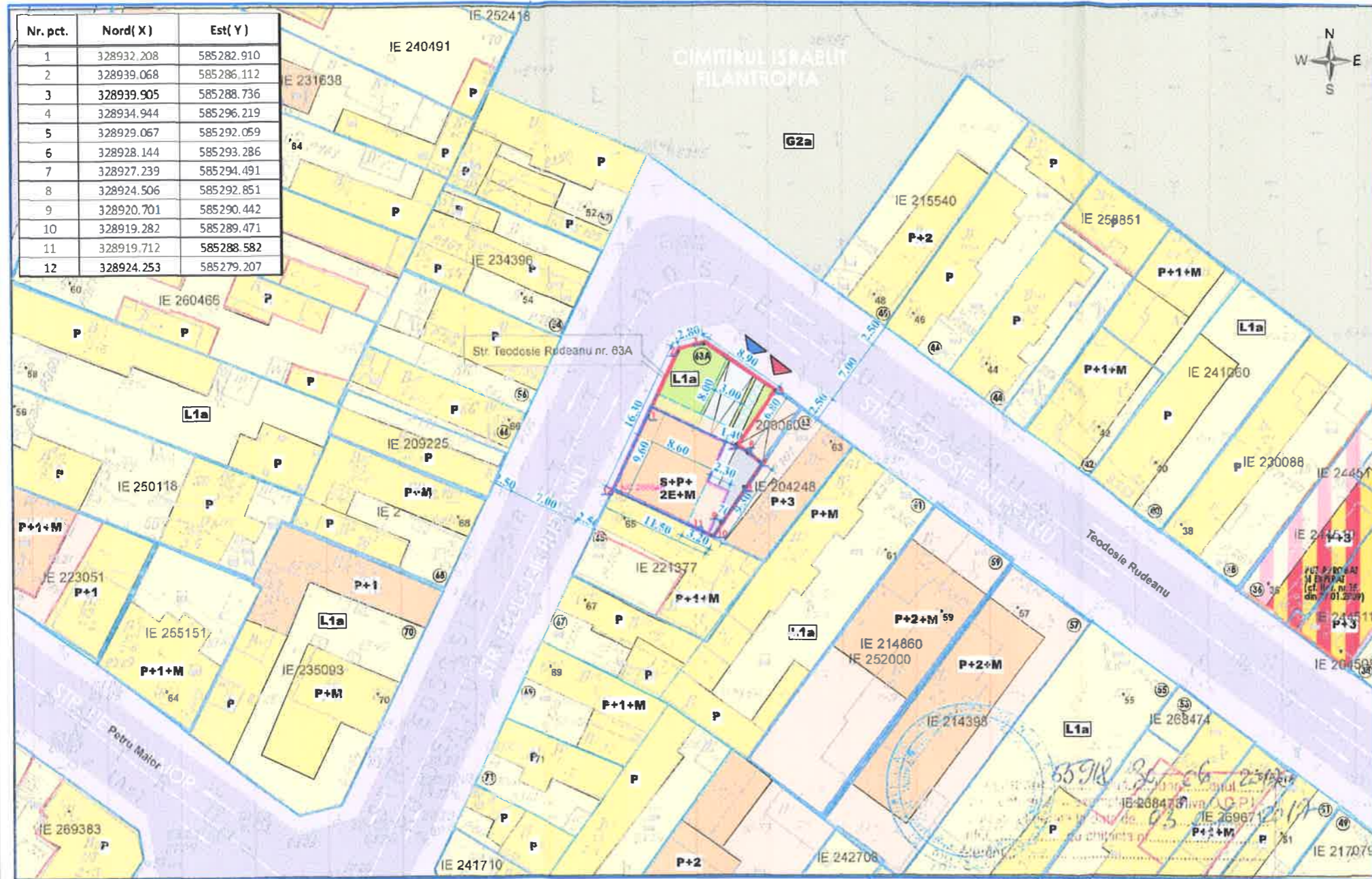
PLAN CADASTRAL scara 1:500 aferent imobilului situat in Str. Teodosie Rudeanu nr. 63A, sector 1, Bucuresti