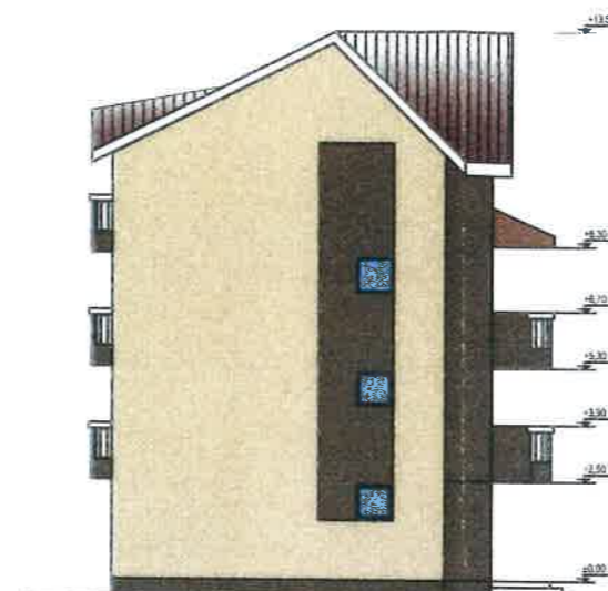
FATADA LATERALA STANGA