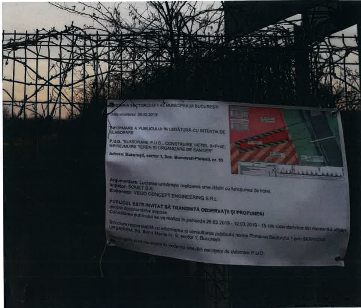
Data expunere panou 26.02.2019