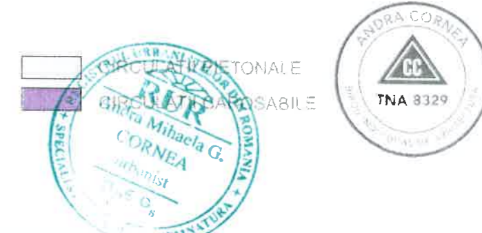
PLAN URBANISTIC DE DETALIU-BILANT TERITORIAL CONSTRUCTIE IMOBIL LOCUINTA INDIVIDUALA P+1E+M -Str. Cetatea Neamtului, nr. 2, sector 1, Bucuresti

PROPUNERE prin PUD S teren = 292 mp P.O.T.max = 45 % C.U.T.max = 0,9 Rh max la cornisa fata de C.T.A. = P+1+M