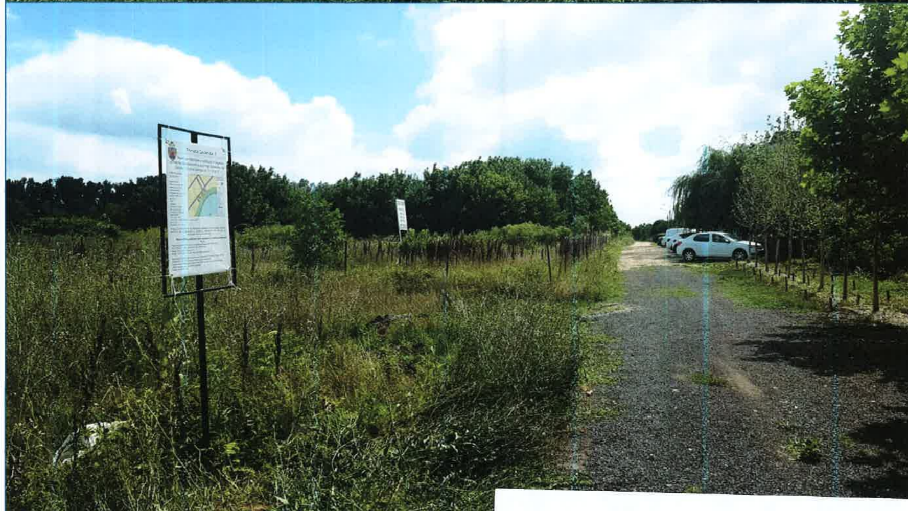
PANOU AMPLASAT PE 28.06.2018