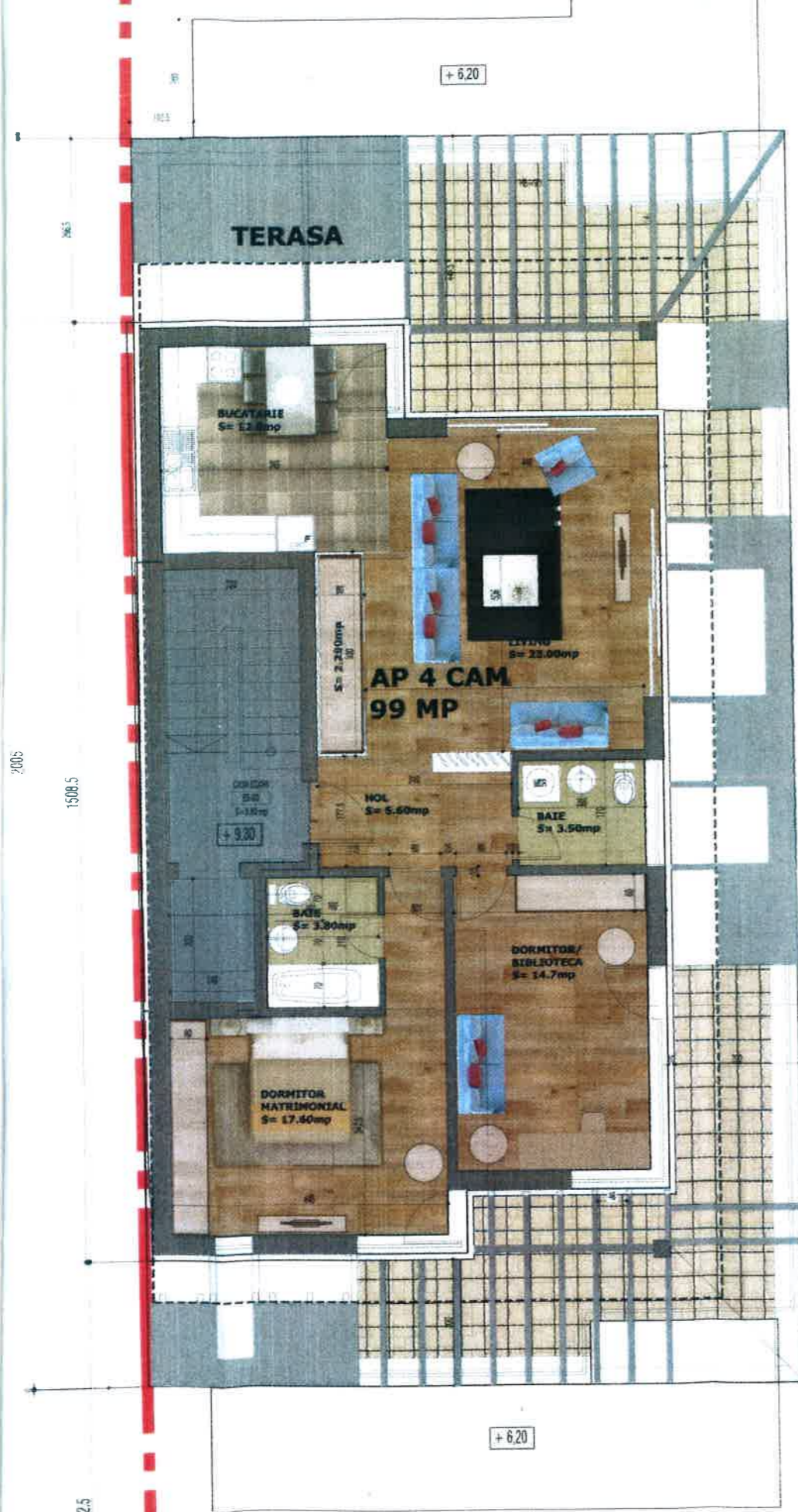
Mansarda Sc = 111,00mp