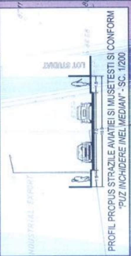
PROFIL PROPUS STRAZILE AVIATIEI SI MUSETESTI SI CONFORM "PUZ INCHIDERE INEL MEDIAN" - SC. 1/200