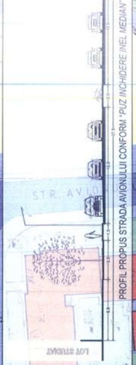
PROFIL PROPUS STRADA AVIONULUI CONFORM 'PUZ INCHIDERE INEL MEDIAN'