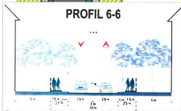
PROFIL STRADA DRUMUL LAPUS CONFORM PUZ ZONA DE NORD, SECTOR 1, BUCURESTI