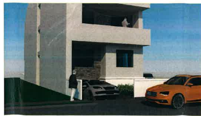
detaliu acces subsol