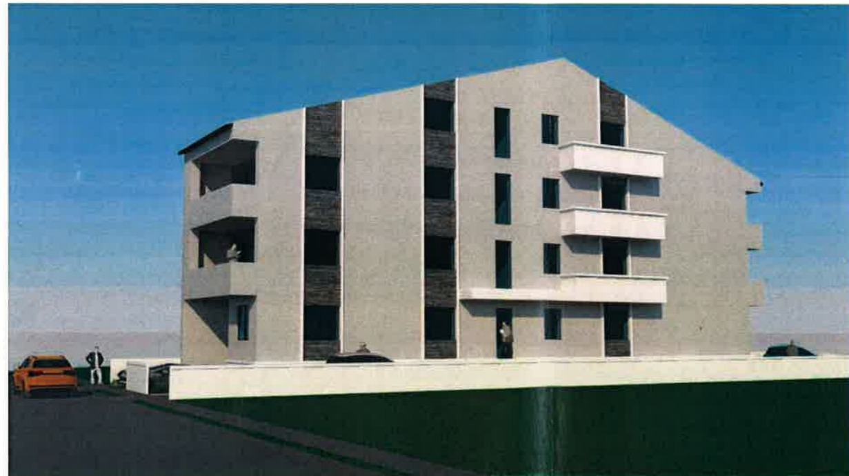
fatada laterala dreapta