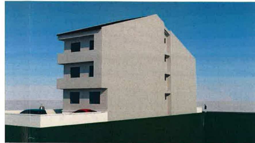
fatada laterala stanga - calcan