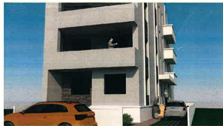
detaliu acces auto pe teren