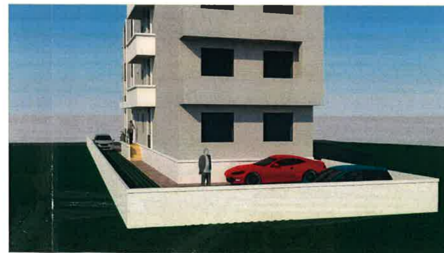
detaliu parcare pe teren