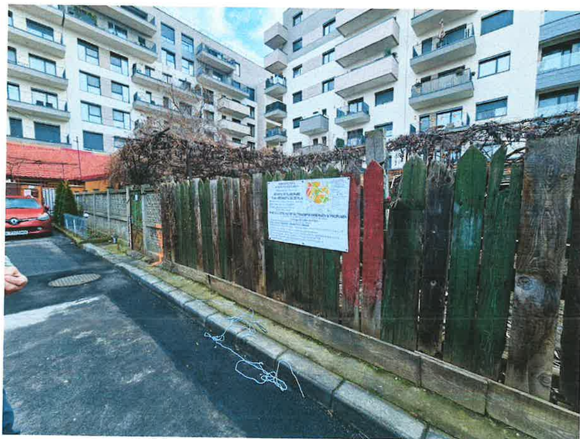
Figura 1. Vedere spre teren reglementat din Intrarea Sutașului (vedere spre nord-est) – cu panou informare publică amplasat.