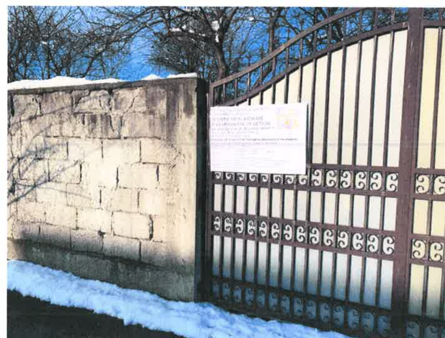
Data fotografii: 08/02/2020