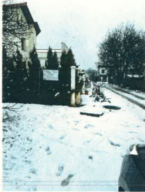
Figura 1. Vedere spre teren reglementat din strada Drumul Lăpuş - cu panou informare publică amplasat.