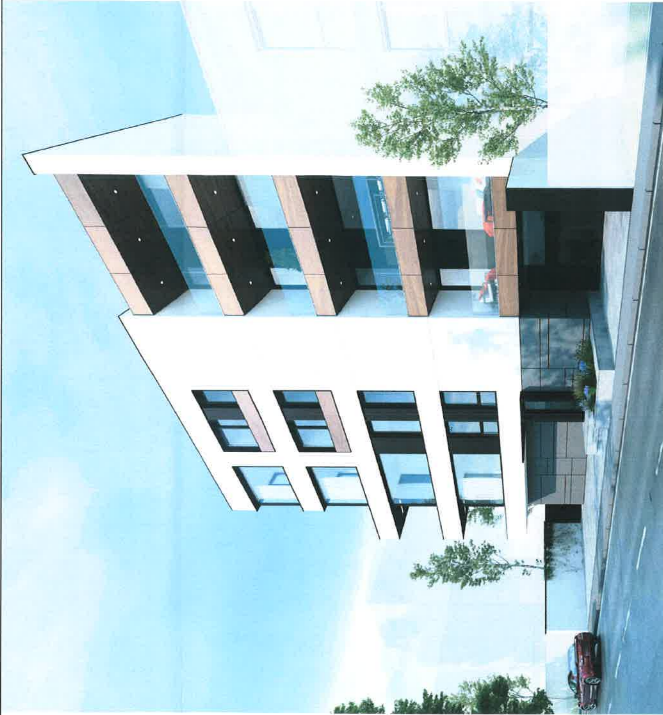
Perspectivă către stradă