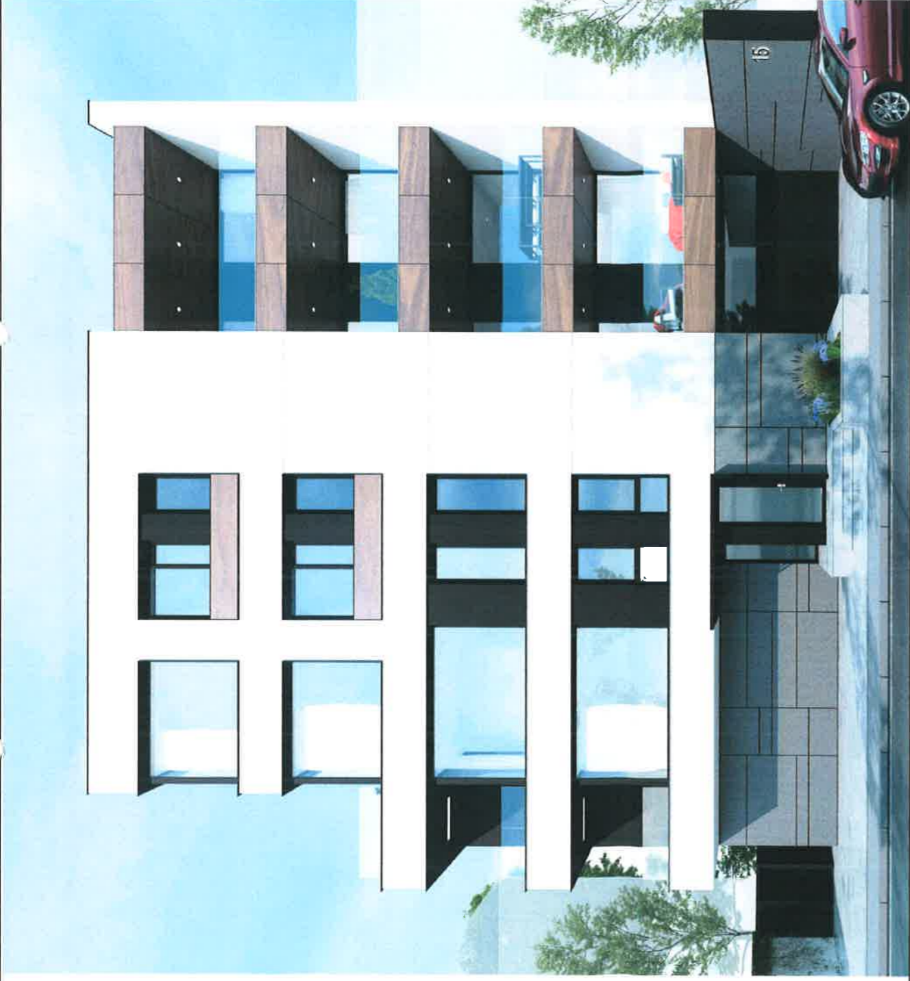
Perspectivă frontală către stradă