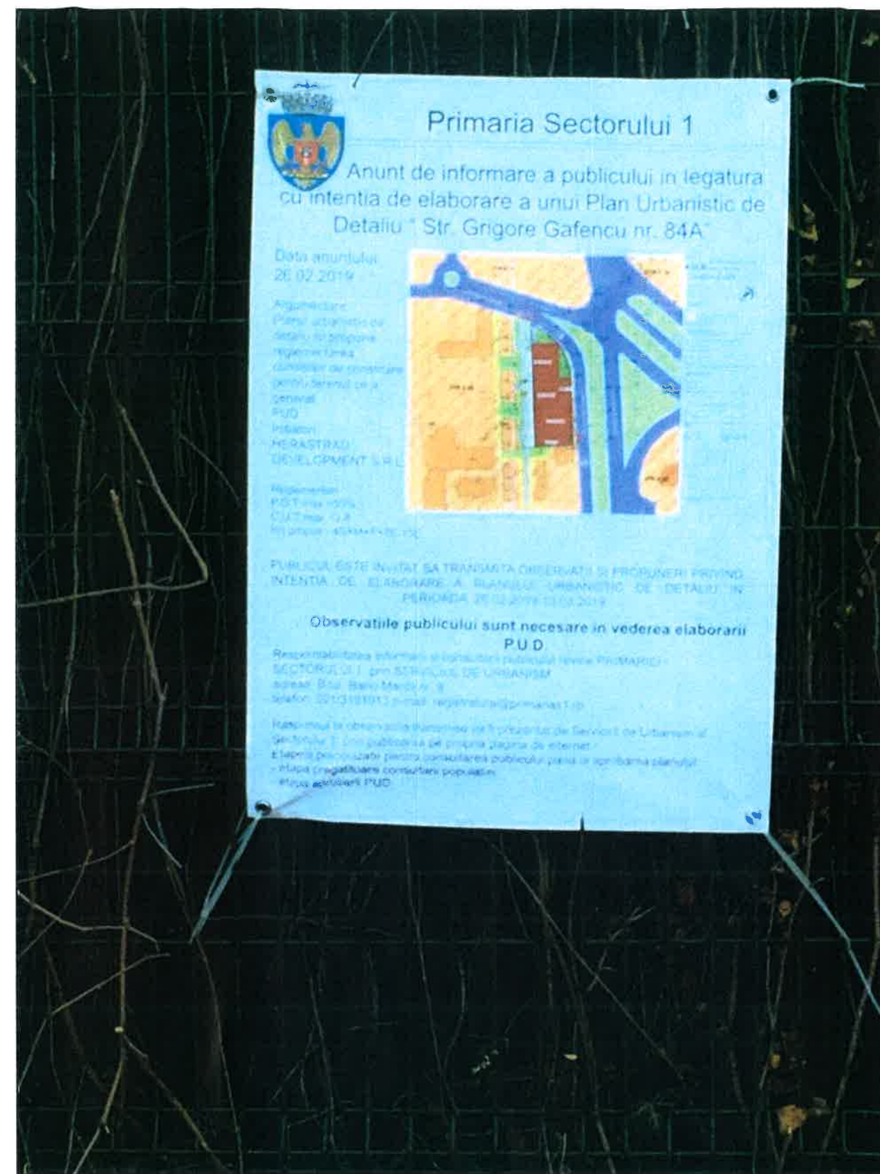
PANOU AMPLASAT PE 26.02.2018