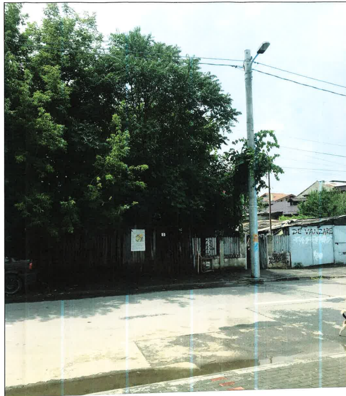
PANOU AMPLASAT PE 28.06.2018