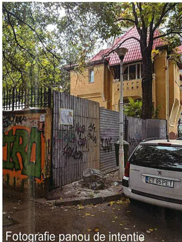
Fotografie panou de intentie