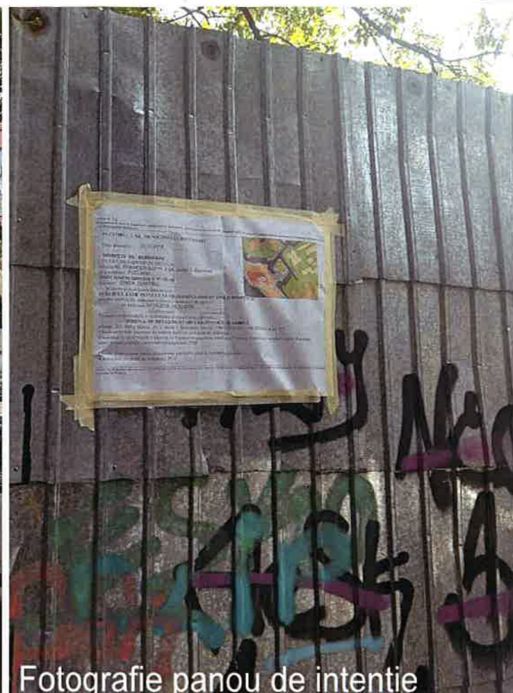
Fotografie panou de intentie