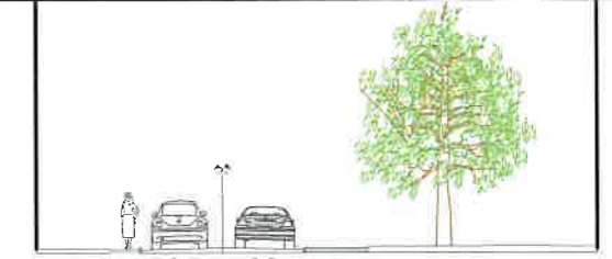
PROFIL A-A STR. PIVNICERULUI